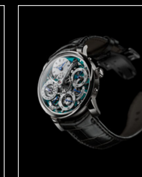
LM PERPETUAL TI FACE