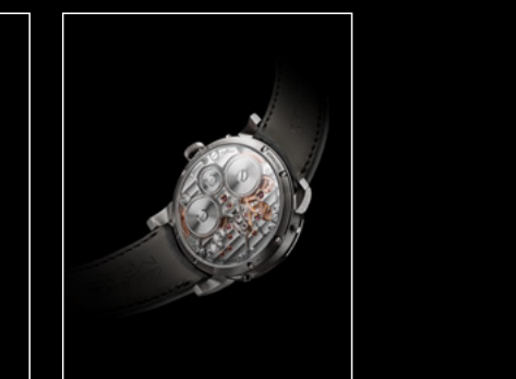
LM PERPETUAL WG BACK