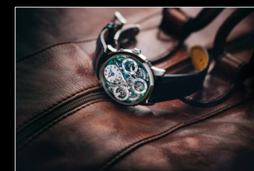
LM PERPETUAL TI LIVE SHOT 1