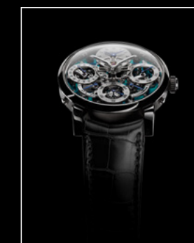
LM PERPETUAL TI