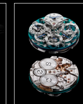
LM PERPETUAL TI ENGINE