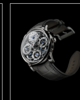
LM PERPETUAL WG FRONT