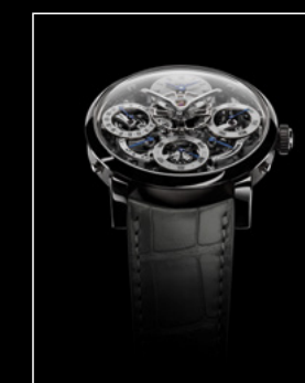
LM PERPETUAL WG FACE