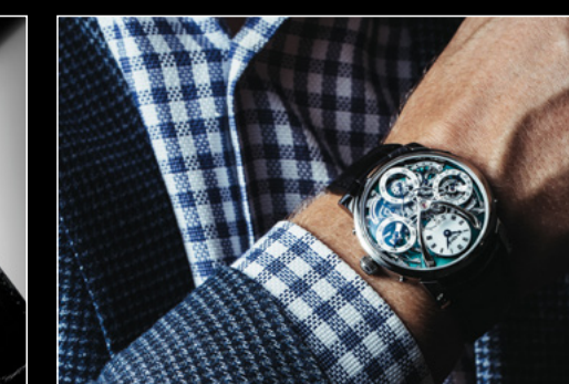
LM PERPETUAL TI WRIST SHOT