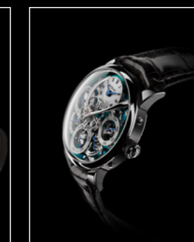
LM PERPETUAL TI FRONT