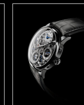
LM PERPETUAL WG PROFILE