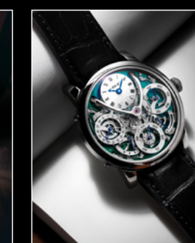
LM PERPETUAL TI LIVE SHOT 2