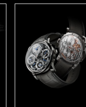
LM PERPETUAL WG