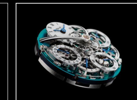
LM PERPETUAL TI ENGINE CLOSE-UP