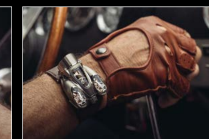
HM9 'FLOW' ROAD EDITION WRIST SHOT 02