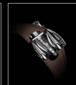
HM9 'FLOW' ROAD EDITION BACK