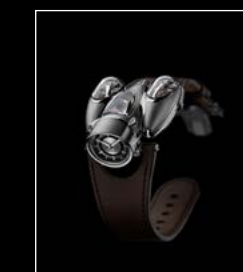
HM9 'FLOW' ROAD EDITION FRONT