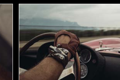
HM9 'FLOW' ROAD EDITION WRIST SHOT 04