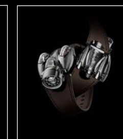
HM9 'FLOW' ROAD EDITION