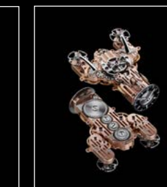
HM9 'FLOW' ENGINE 1