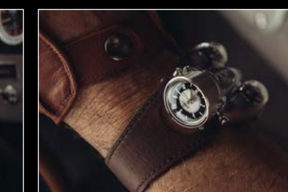
HM9 'FLOW' ROAD EDITION WRIST SHOT 03