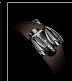
HM9 'FLOW' AIR EDITION BACK