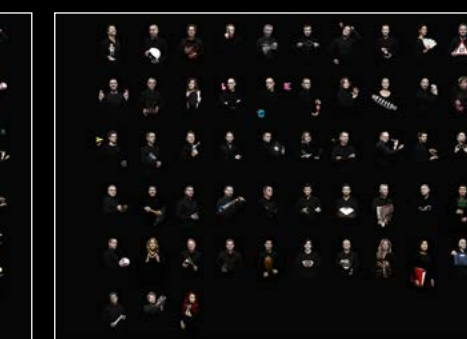
HM9 'FLOW' FRIENDS LANDSCAPE