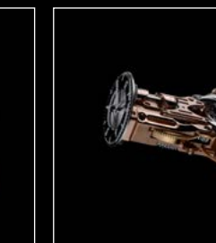
HM9 'FLOW' ENGINE 2