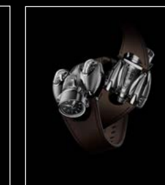
HM9 'FLOW' AIR EDITION