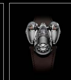
HM9 'FLOW' ROAD EDITION FACE