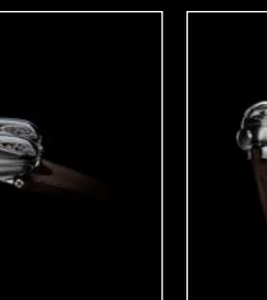
HM9 'FLOW' REAR