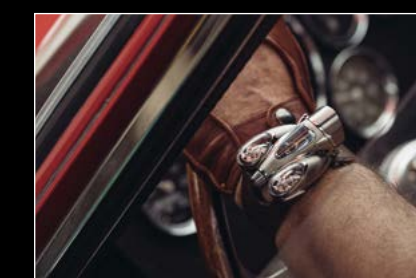
HM9 'FLOW' ROAD EDITION WRIST SHOT 01