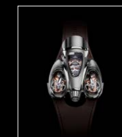
HM9 'FLOW' TOP