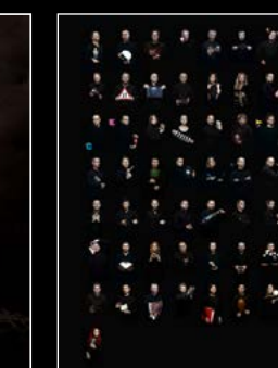
HM9 'FLOW' FRIENDS PORTRAIT