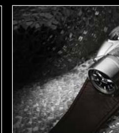
HM9 'FLOW' AIR EDITION LIVE SHOT