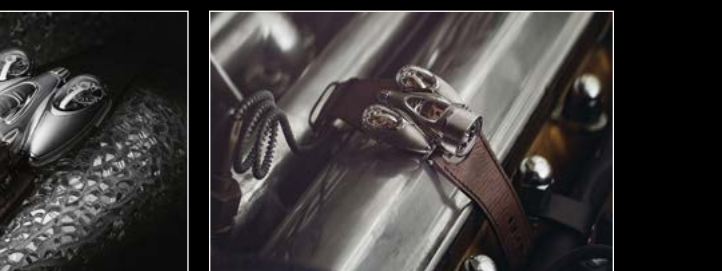
HM9 'FLOW' ROAD EDITION LIVE SHOT