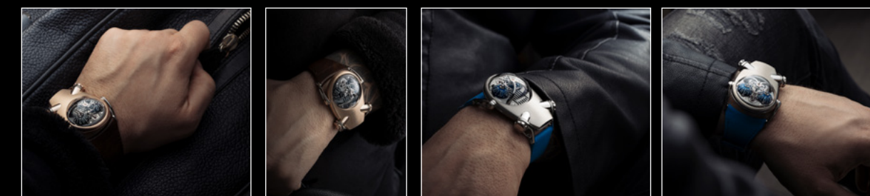
HM10 BULLDOG WRISTSHOT 1