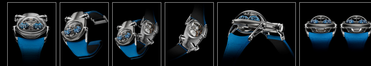
HM10 BULLDOG TI FACE