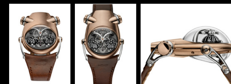
HM10 BULLDOG RT PACKSHOT WHITE