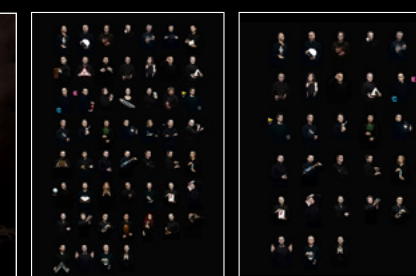
HM10 BULLDOG FRIENDS PORTRAIT